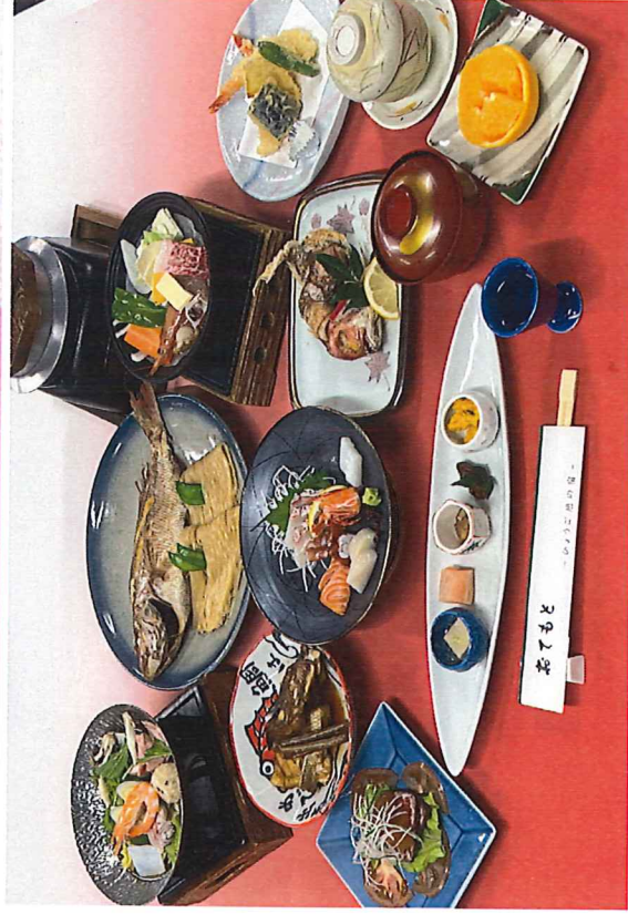
鯛そうめんは大皿料理(写真は2人盛り)です。人数により盛りつけが変わる場合があります。 【に宿泊】 1泊2食/お一人様 17,500円 (税込) 金土曜・休前日は1,100円UP

鯛そうめんは瀬戸内を代表する郷土料理です。 そうめんは播州地方名産揖保乃糸を使っています。