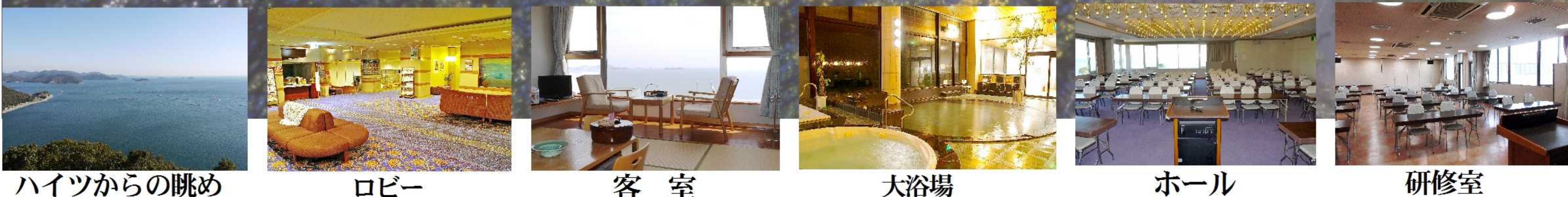
ハイツからの眺め